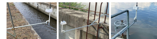
パイプを土手に打ち込み固定 ハシゴのパイプにクランプで固定 水門パイプにバンドで固定

○こちらのfarmoサービスサイトでさまざまな設置例写真・使用資材をご確認いただけます。 https://farmo.info/aqua_secchi/