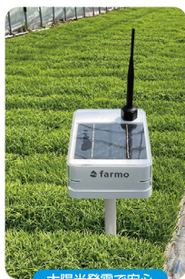
太陽光発電で安心

それぞれお持ちのスマートフォンにアプリをインストールすれば、同じデータを皆さまで見ることができます。製品IDを入力するだけでご家族みんなで一緒に管理ができます。