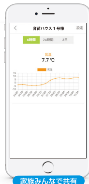
家族みんなで共有

苗床の温度は5分間隔で更新され、いつでもハウス内の温度を確認することができます。一日の苗床の温度をグラフでも確認でき、安心して管理できるようになります。